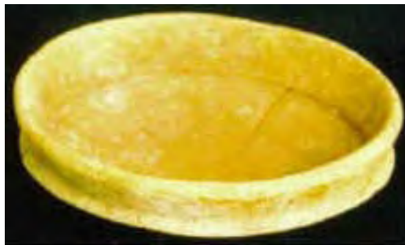
Vasija 7, Tumba 2, Chan Chich, Belice.