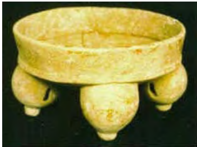
Vasija 8, Tumba 2, Chan Chich, Belice.

Tres de los coronamientos de la tumba se encontraron en su lugar, en sus posiciones originales, revelando la configuración original de la misma. Gran parte de las losas habían colapsado a distintas profundidades dentro de la cámara. Las losas del centro de la tumba fueron las que cayeron más lejos, y su caída precipitó la creación del agujero en la superficie de la plaza. Debe tenerse en cuenta que la losa que cayó a mayor distancia no cayó totalmente sobre el piso de la tumba. En cambio, fue a dar sobre un claro sedimento blancuzco de marga a un nivel de unos 15 cm por sobre el piso de la tumba. No está claro si esta marga se depositó a través de procesos naturales o culturales. En cualquier caso, la capa de relleno protegió los contenidos de la tumba evitando que quedaran aplastados por las losas derrumbadas. Por otro lado, este depósito de marga formó un entorno depositacional muy áspero, que probablemente aceleró el deterioro del material esquelético humano y varios de los demás artefactos.