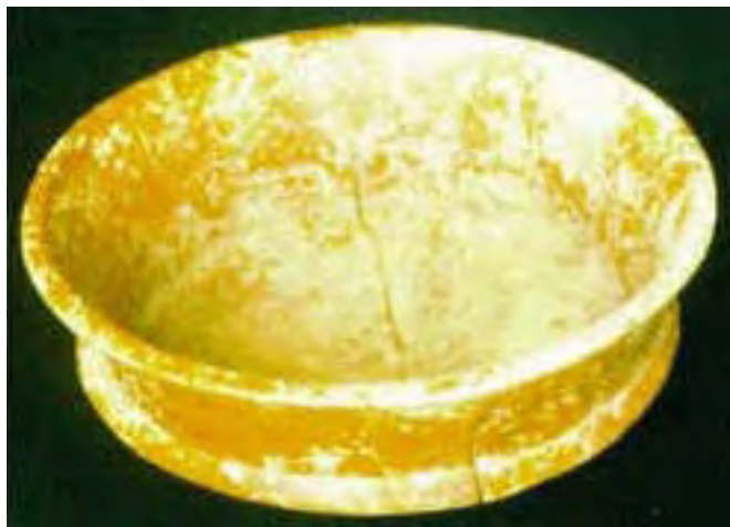
Vasija 4, Tumba 2, Chan Chich, Belice.