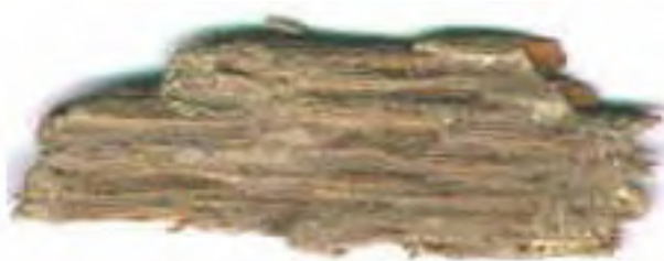
Fragmento de una parihuela de madera, Tumba 2, Chan Chich, Belice.

Entre los artefactos de jade había dos orejeras, una cuenta tubular, y un colgante esculpido. De particular interés es el colgante de jade de un tipo conocido como casco con babero, que se basa en el uso en la cabeza de un tocado con forma de casco, y que tiene un objeto en forma de babero que rodea la parte inferior del rostro. Este tipo de artefacto ha sido fechado para el Preclásico Tardío y por lo general sólo se lo encuentra en contextos de élite.