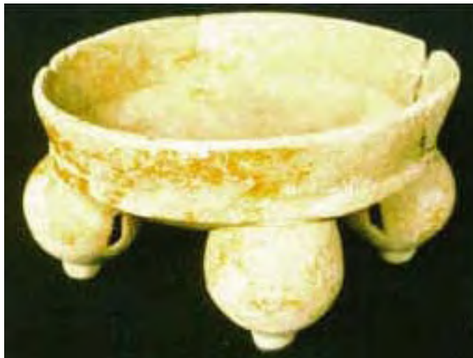
Vasija 9, Tomb 2, Chan Chich, Belice.

mandíbula se separó de la calavera, éste cayó o caso contrario fue movido hacia el área del pecho del individuo. Tres de los dientes recuperados estaban decorados.