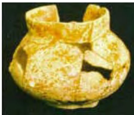
Vasija 6, Tumba 2, Chan Chich, Belice.

La sección de la tumba que quedó expuesta durante la temporada de campo de 1997, había sido cubierta con nueve grandes losas de forma rectangular o coronamientos de piedra caliza, orientadas en dirección este-oeste y puestas lado a lado sobre la parte superior de la tumba. La forma vista en planta de la tumba era elipsoidal, con las losas que cubrían el centro de la tumba ligeramente más largas que las de cada uno de los extremos. La tumba y la gran matriz de piedra ubicada sobre ella estaban completamente selladas por la construcción de un piso Protoclásico. Más adelante, pero también en el Protoclásico, se construyó sobre este piso una estructura pequeña, baja, y con muros de piedra.