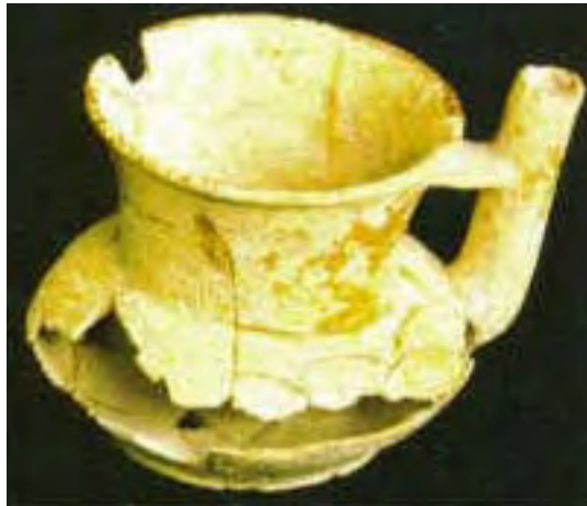
Vasija 3, Tumba 2, Chan Chich, Belice.