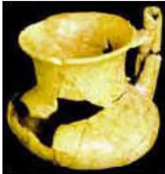
Vasija 1, Tumba 2, Chan Chich, Belice.