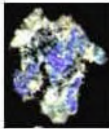
Fragmento de papel de amate (ampliado 4X) con pinceladas azules y negras, Tumba 2, Chan Chich, Belice.