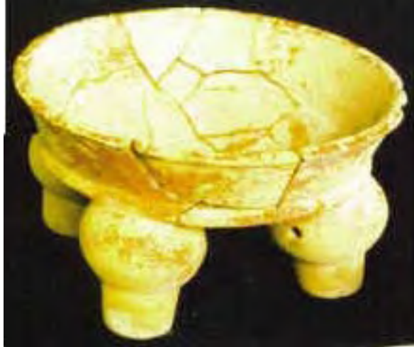
Vasija 2, Tumba 2, Chan Chich, Belice.