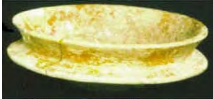
Vasija 10, Tumba 2, Chan Chich, Belice.

del concepto de divina dignidad real entre los mayas de las tierras bajas. Independientemente de cuál es el origen del concepto, ya sea que se trate de una invención maya o de una institución cultural tomada de otros, los maya de Chan Chich estaban participando de una gran revolución cultural. Esta revolución transformó su estructura política y social y dió como resultado un nuevo concepto de identidad para los mayas de las tierras bajas.