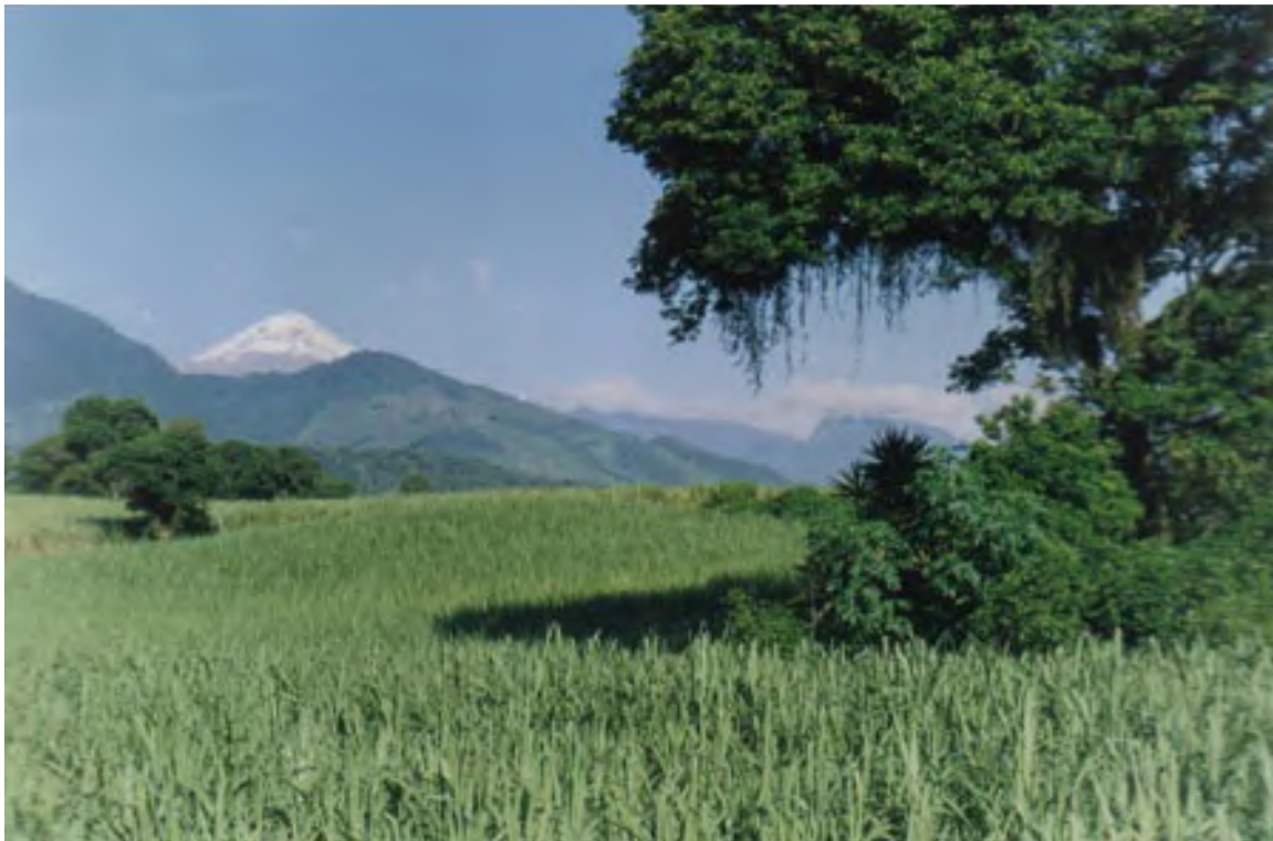
Figura 4. La Yerbabuena: vista del volcán de Pico de Orizaba desde el lado oeste de la Pirámide 1. Mirando hacia el noroeste.