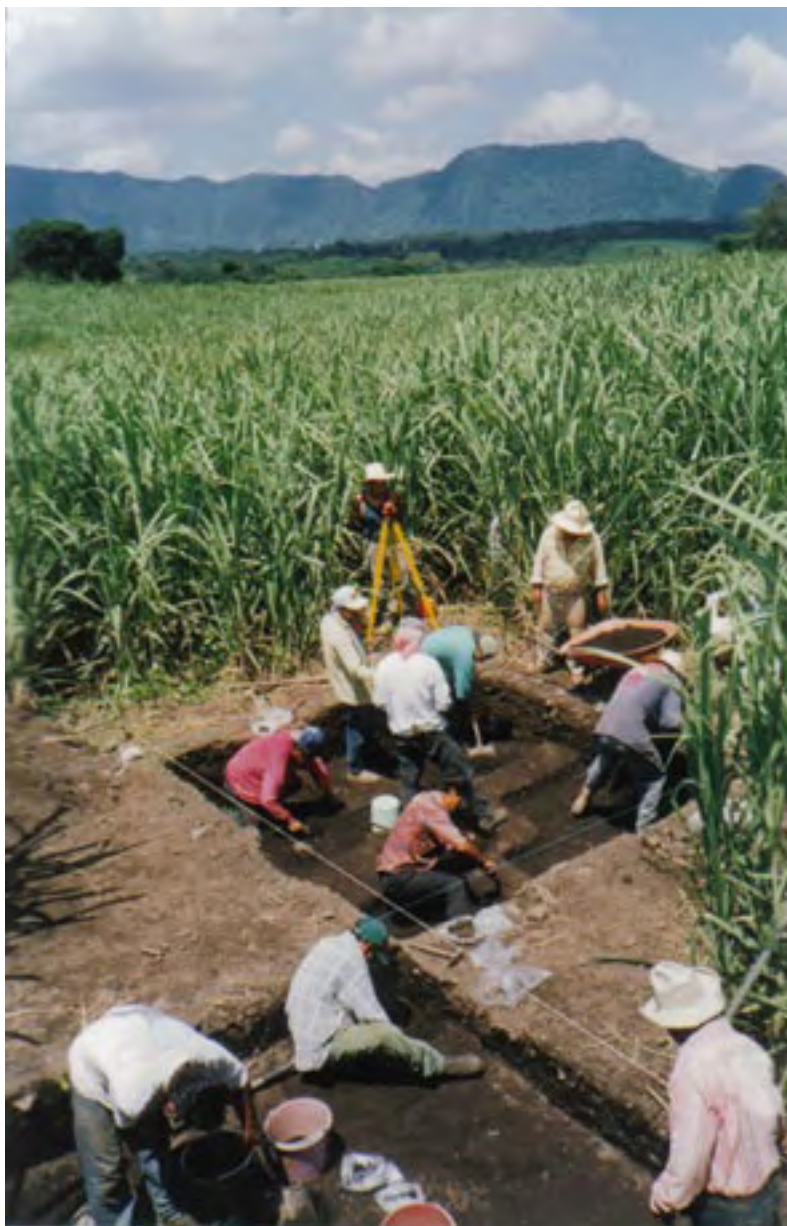
Figura 20. La Yerbabuena (Unidad 91). Excavaciones en el borde este de la pirámide que fue destruida por los agricultores unos diez años atrás.

Casi todos los terratenientes de La Yerbabuena han cooperado de buena gana con las metas de nuestro proyecto, y ellos, junto con los miembros del comité de la Casa de Cultura de Tomatlán, Veracruz, parecen haber ahuyentado a los saqueadores del sitio. Nosotros hallamos sólo un pozo más de saqueo en el sitio (sobre el lado oeste de la Pirámide 1), que parece haber sido abierto unos seis meses antes de que comenzáramos con nuestro trabajo de campo.