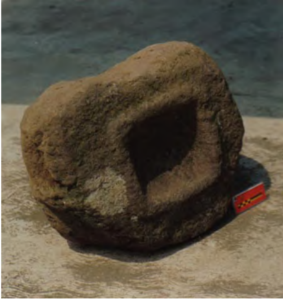
Figura 17. La Yerbabuena. Probable monumento olmeca hallado en la superficie, 70 metros al noroeste de la Pirámide 1.