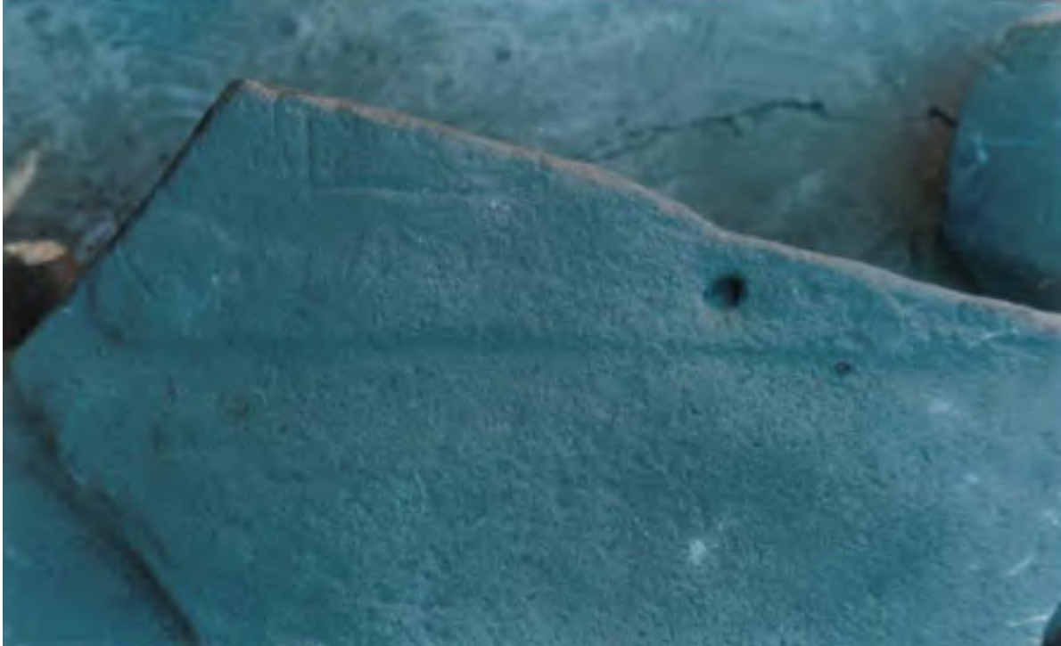
Figura 9. La Yerbabuena. Primer plano de la sección esculpida del fragmento que se observa en la Figura 8. La figura humana principal del Monumento 1 probablemente apareciera de pie sobre esta franja esculpida. El agujero redondo en el centro de la franja probablemente haya sido hecho por el formón de algún saqueador.

Durante el primer día de trabajo recuperamos dos fragmentos del monumento ( Figura 7 , Figura 8 , y Figura 9 , arriba). El fragmento más importante consistió en la mayor parte de la base del monumento, que contiene la franja esculpida sobre la cual probablemente estuviera, de pie, la figura principal del monumento.