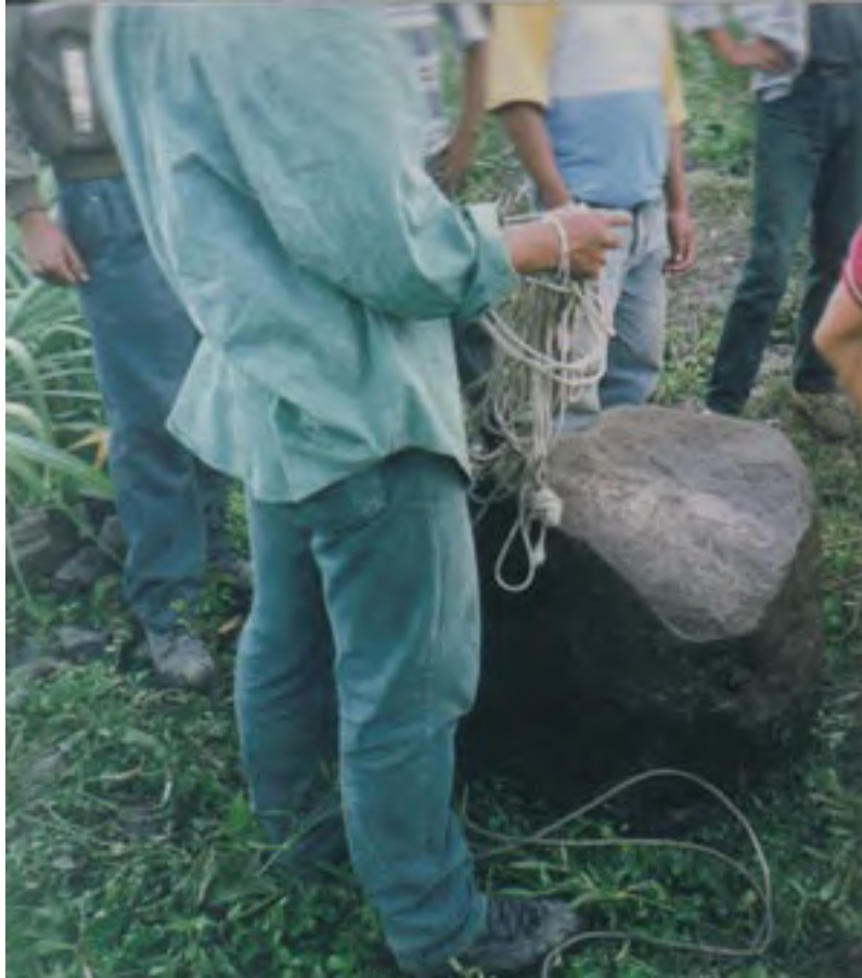
Figura 7. La Yerbabuena (Unidad 80). Probable fragmento del Monumento 1 hallado en la pila de escombros dejada por los saqueadores, que se observa en la Figura 6. Este fragmento no mostraba que hubiera sobrevivido ninguna superficie esculpida. Probablemente sea parte de la sección superior de la estela.