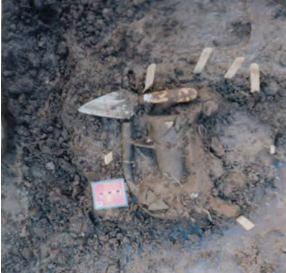
Figura 21. La Yerbabuena (Unidad 53). Vasija con forma de tetera del Formativo Terminal hallada en una ofrenda arriba de los pisos de una casa del Formativo Tardío.