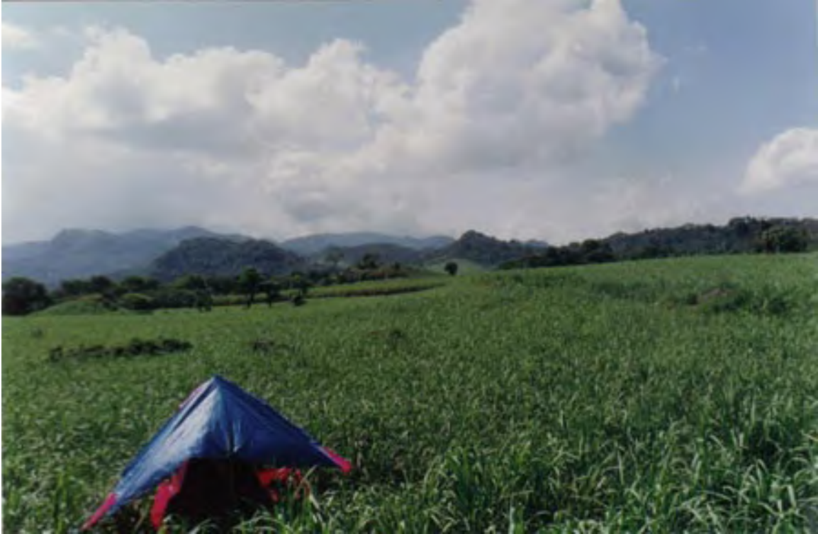
Figura 18. La Yerbabuena. Vista general de la plaza principal, mirando hacia el sudeste desde la plataforma, en el borde sur de la Pirámide 1.