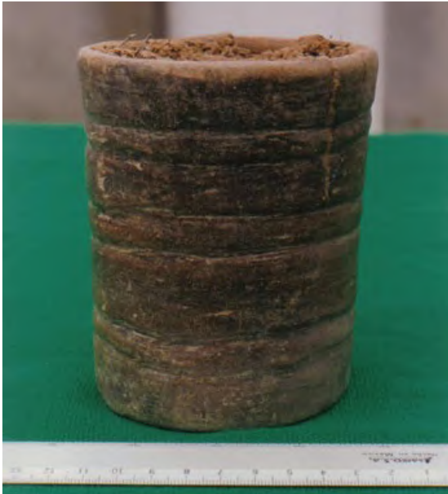
Figura 14. La Yerbabuena (Unidad 80). Probable vaso del Formativo Medio encontrado en calidad de ofrenda en la plataforma del Monumento 1.