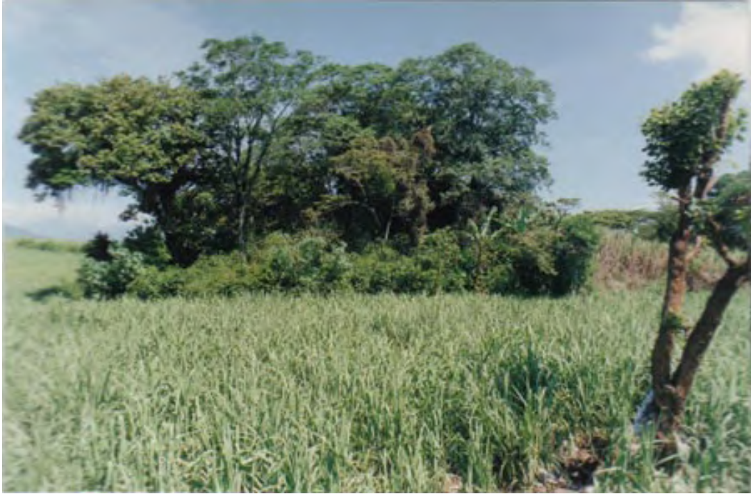
Figura 5. La Yerbabuena. Pirámide 1 - mirando hacia el noroeste. La estela (Monumento 1) estaba sobre una gran plataforma aproximadamente a 2-5 metros al oeste del árbol, en el ángulo inferior a mano derecha de la fotografía.