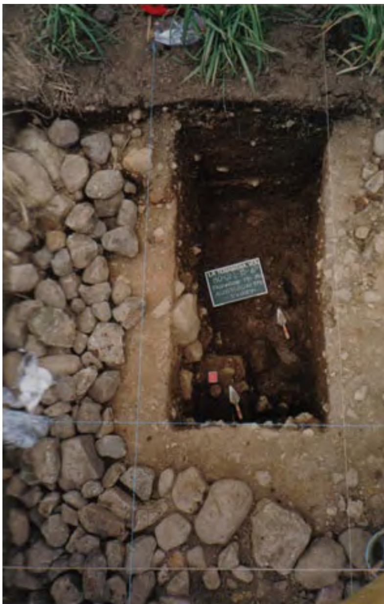
Figura 13. La Yerbabuena (Unidad 80). Excavación en la plataforma donde se hallaba el Monumento 1. En el ángulo sudeste de esta excavación se halló un vaso del Formativo Medio, en calidad de ofrenda.

Las cerámicas de las excavaciones en la plataforma en la que estaba situado el monumento, le dan a esta estructura un fechamiento para el Formativo Medio (probablemente entre el 800-600 a.C.), que corresponde a la fecha probable del monumento, dadas sus similitudes estilísticas con las esculturas olmecas de La Venta, Tabasco. Encontramos una escalera bien preservada ( Figura 11 y Figura 12 ) en el borde de la plataforma, asociada con la ofrenda de un vaso intacto del Formativo Medio ( Figura 13 , arriba, y Figura 14 , abajo).