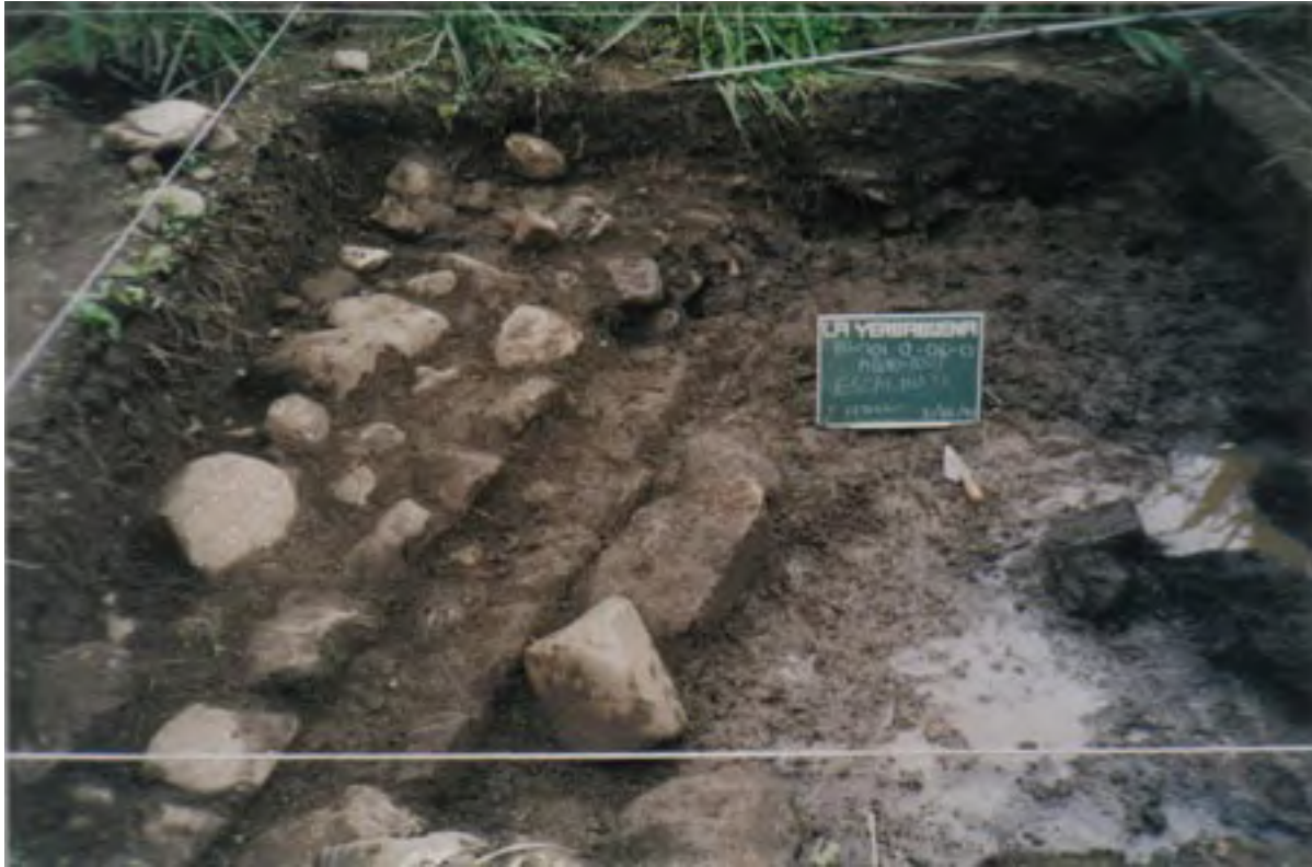
Figura 12. La Yerbabuena (Unidad 80). Primer plano de la excavación de la escalera que se observa en la Figura 11.

Los geofísicos de la Subdirección de Apoyo Académico del INAH decidieron no hacer una prospección con radar o magnética en La Yerbabuena porque el sitio posee tantas formaciones naturales de rocas ígneas (entre ellas los basaltos), que los fragmentos del monumento no habrían podido ser detectados. Hemos pasado más de una semana haciendo sondeos en la totalidad del área de la Unidad 80 con palos de madera afilados similares a palancas a una profundidad de 70 cm, pero no hemos hallado los fragmentos esculpidos faltantes. Probablemente será necesario abrir excavaciones tipo trincheras en la mayor parte de la Unidad 80 para hallar estos fragmentos, pero los terratenientes quieren entre $2,000-3,000 dólares en concepto de daño a sus cultivos para autorizarnos a realizar esta tarea. Trataré de conseguir el dinero para hacer este trabajo durante nuestra próxima temporada de campo.