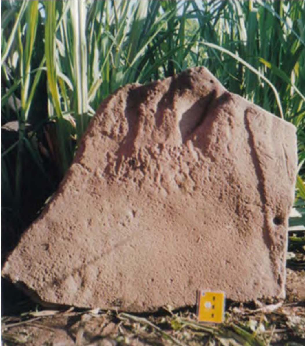
Figura 8. La Yerbabuena (Unidad 80). Fragmento de la base del Monumento 1 hallado en un canal moderno, 22 metros al sudeste de la pila de escombros, donde el otro fragmento de monumento (Figura 7) fue recuperado.