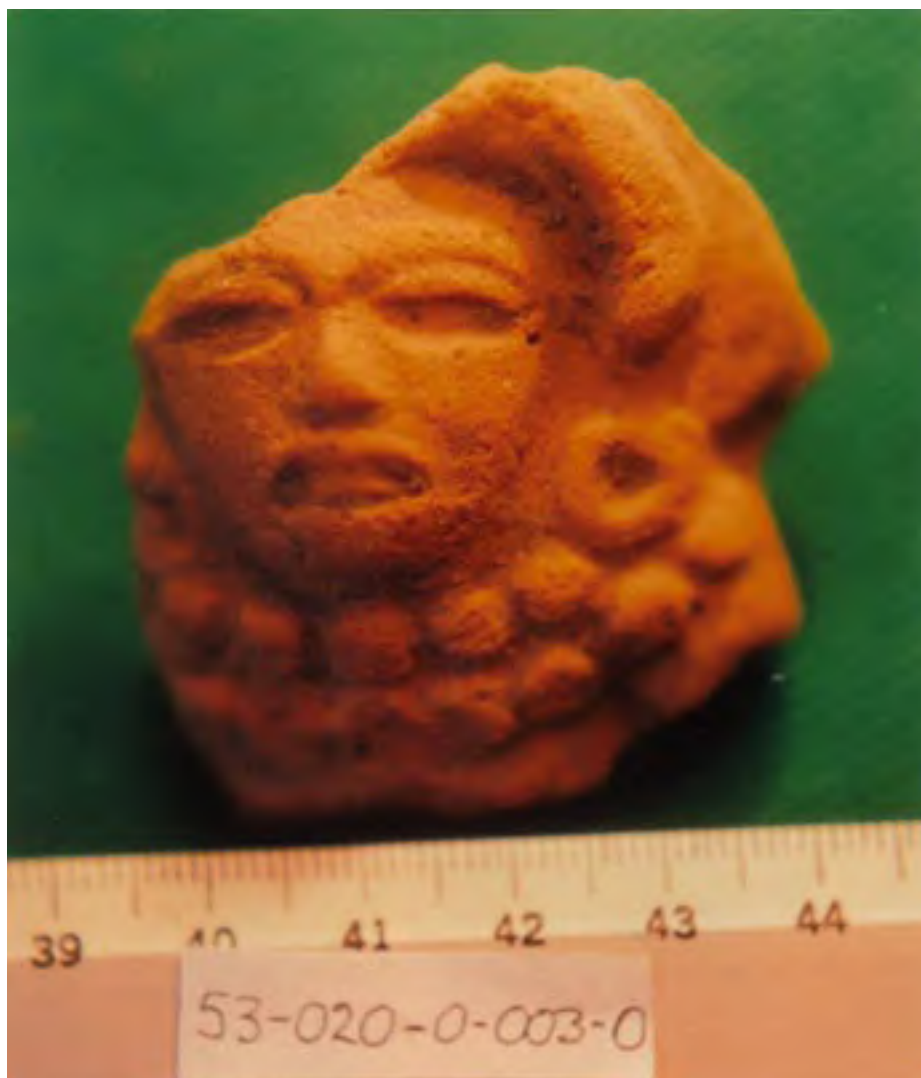
Figura 22. La Yerbabuena (Unidad 53). Figurilla de estilo teotihuacano, del Clásico Temprano, hallada en un depósito de basura arriba de los pisos de una casa del Formativo Tardío.

Pareciera que hubo ocupaciones importantes del Clásico Temprano (circa 200-600 d.C.) en algunos sectores de las periferias de los recintos ceremoniales principales, pero hasta el momento no hemos identificado ninguna cerámica Anaranjada Fina o cualquier otra relacionada con Teotihuacán, con la excepción de una figurilla de estilo teotihuacano que se puede observar en la Figura 22 .