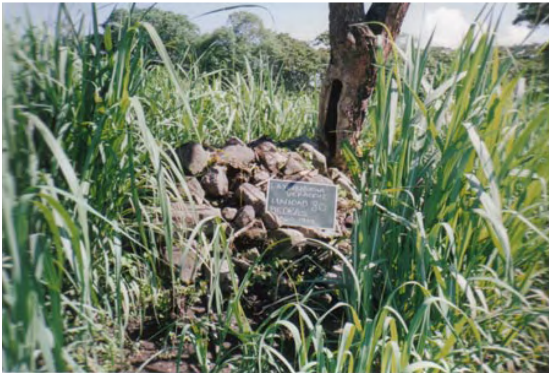
Figura 6. La Yerbabuena (Unidad 80). Pila de escombros dejada por los saqueadores sobre el lado oeste del árbol en la Figura 5. Al menos un probable fragmento del Monumento 1 fue hallado en este escombros.