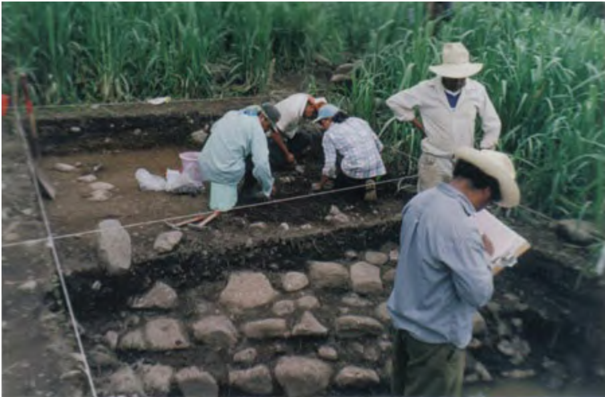
Figura 11. La Yerbabuena (Unidad 80). Excavación de una escalera en la plataforma donde se encontraba el Monumento 1. Probablemente del Formativo Medio.

En las excavaciones en la pila de escombros dejada por los saqueadores ( Figura 6 , arriba) y en la plataforma en la que estaba situado el monumento ( Figura 5 , arriba, y Figura 11 y Figura 12 , abajo), se recuperaron varios otros probables fragmentos sin superficies esculpidas que hayan sobrevivido. Hasta el momento no hemos hallado las secciones que contienen el torso inferior y las piernas de la figura esculpida principal. Estos fragmentos probablemente estén enterrados a menos de un metro por debajo de la superficie de la plataforma de la Pirámide 1, que corresponde a la Unidad 80 de nuestro proyecto. Ninguno de los agricultores de La Yerbabuena ha visto estos fragmentos desde el momento en que el campo pasó del cultivo del maíz a la plantación de caña de azúcar, a principios de la década de 1960.