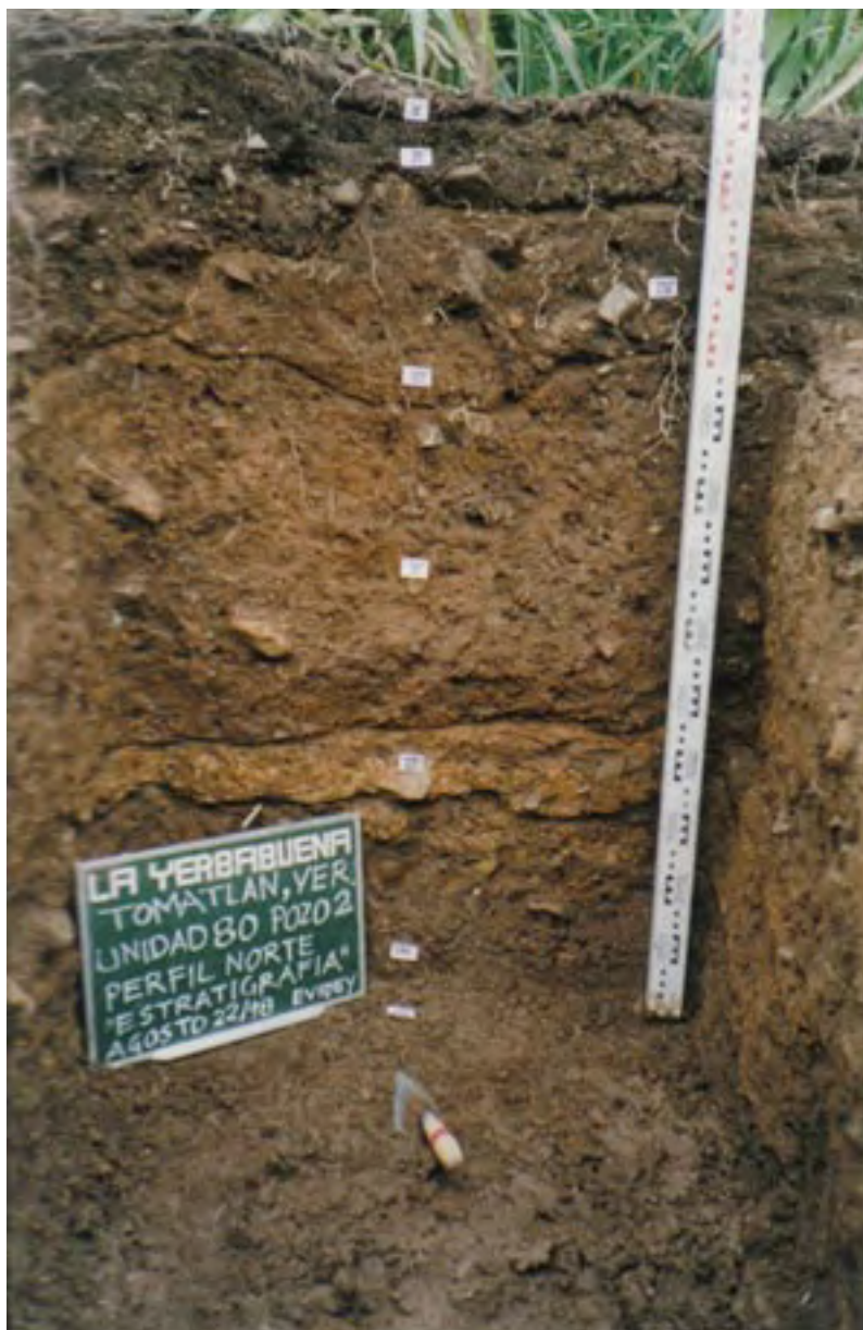
Figura 15. La Yerbabuena (Unidad 80). Estratigrafía parcial de la plataforma del Monumento 1.

Setenta metros al noroeste de la Pirámide 1, hallamos un segundo probable monumento olmeca sobre la superficie, que consistía en una pequeña escultura de basalto similar a un tazón ( Figura 16 , abajo, y Figura 17 ). Este monumento puede haber estado en su posición original sobre la superficie porque está directamente alineado con el Monumento 1, a lo largo del eje noroeste-sudeste del centro ceremonial.