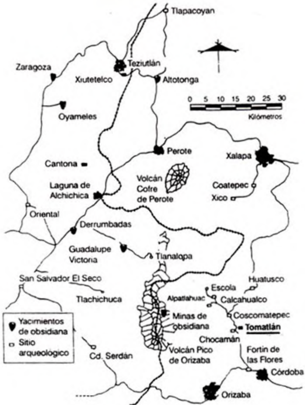
Figura 1. Mapa con la ubicación de Tomatlán, Veracruz, en la región de Pico de Orizaba.

central de La Yerbabuena casi con certeza son del Formativo Tardío, y algunas probablemente tengan importantes componentes del Formativo Medio. (El área mapeada cubre 48.7 hectáreas.)