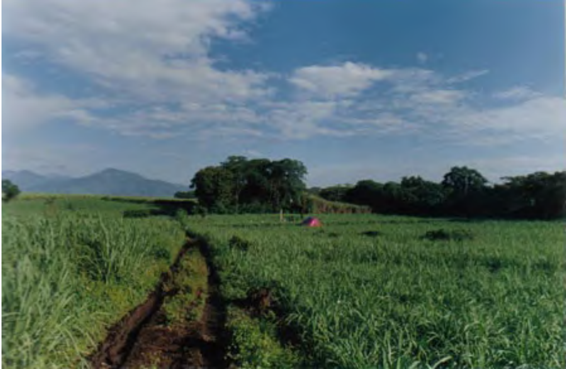
Figura 3. La Yerbabuena: vista de la plaza principal y lugar de la excavación (Unidad 80) frente a la Pirámide 1. Mirando hacia el noroeste.