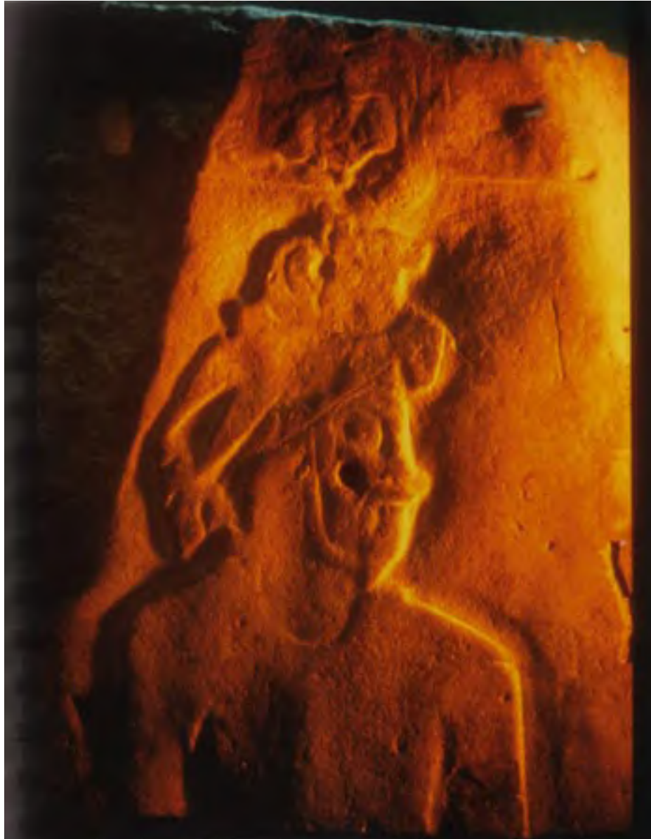
Figura 10. El fragmento original del Monumento 1 de La Yerbabuena que actualmente se encuentra en la plaza de Tomatlán, Veracruz.

pagar los "daños" de los cultivos de caña de azúcar en su campo) se nos permitió comenzar a trabajar.