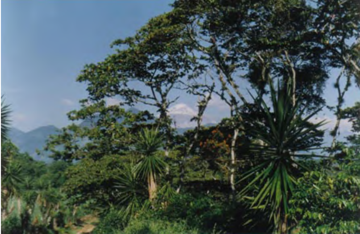
Figura 23. Vista del volcán Pico de Orizaba desde una selva con palmas de izote, cerca de una plantación de café en el borde sur de La Yerbabuena.