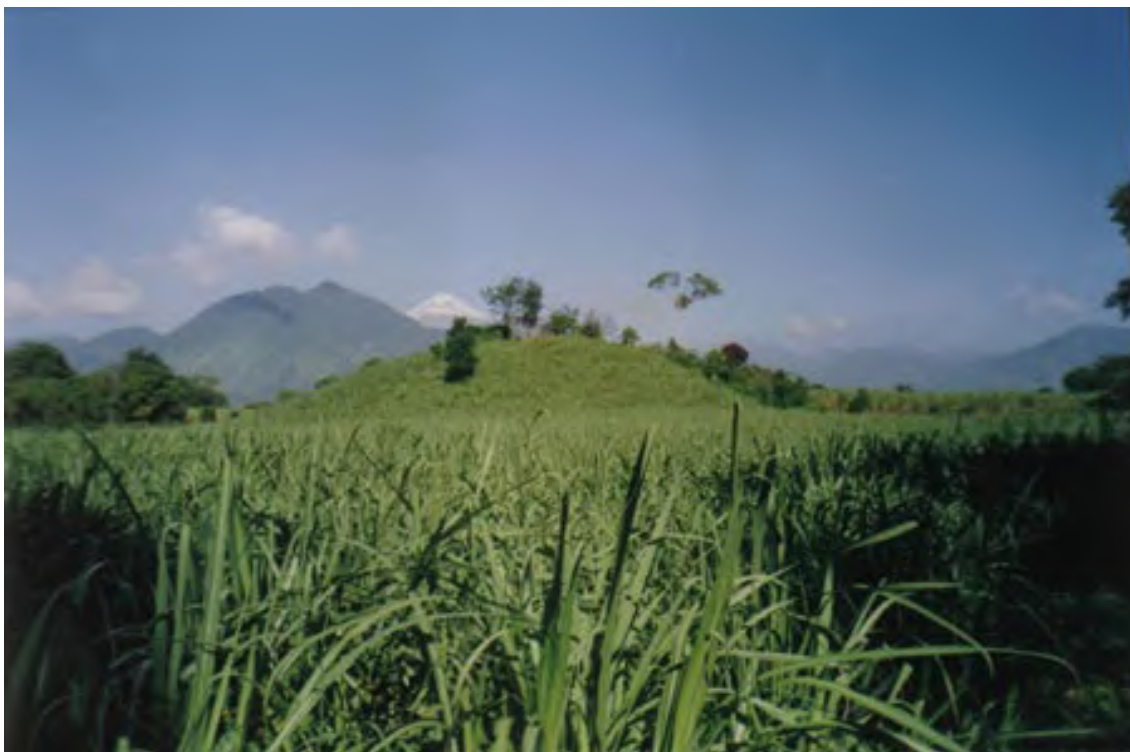
Figura 19. La Yerbabuena. (Unidades 70, 71, 74). Vista de la Pirámide 2 y un área de talleres de obsidiana que fue estudiada y excavada. Mirando hacia el noroeste.