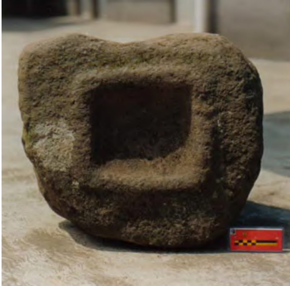
Figura 16. La Yerbabuena. Probable monumento olmeca hallado en la superficie, 70 metros al noroeste de la Pirámide 1.