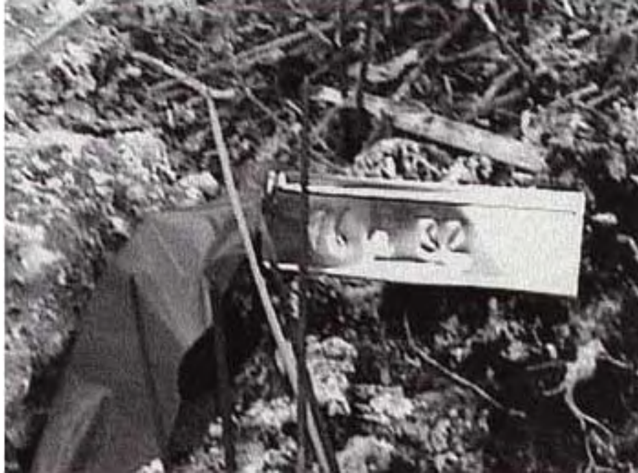
Figura 6. A cada elemento se le colocó un rótulo permanente de aluminio.