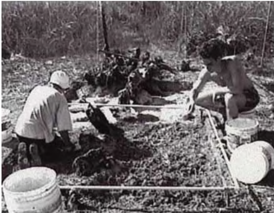
Figura 10. Excavaciones en el Alineamiento 41.

Se excavaron unidades de 2 m x 2 m hasta el lecho rocoso, cuyos niveles de excavación estaban separados por divisiones estratigráficas naturales y/o por intervalos