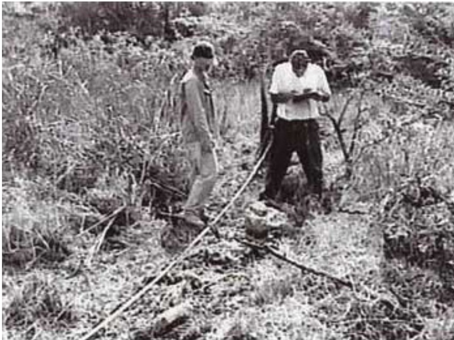
Figura 4. Mapeando un alineamiento rocoso en las tierras húmedas de El Edén.