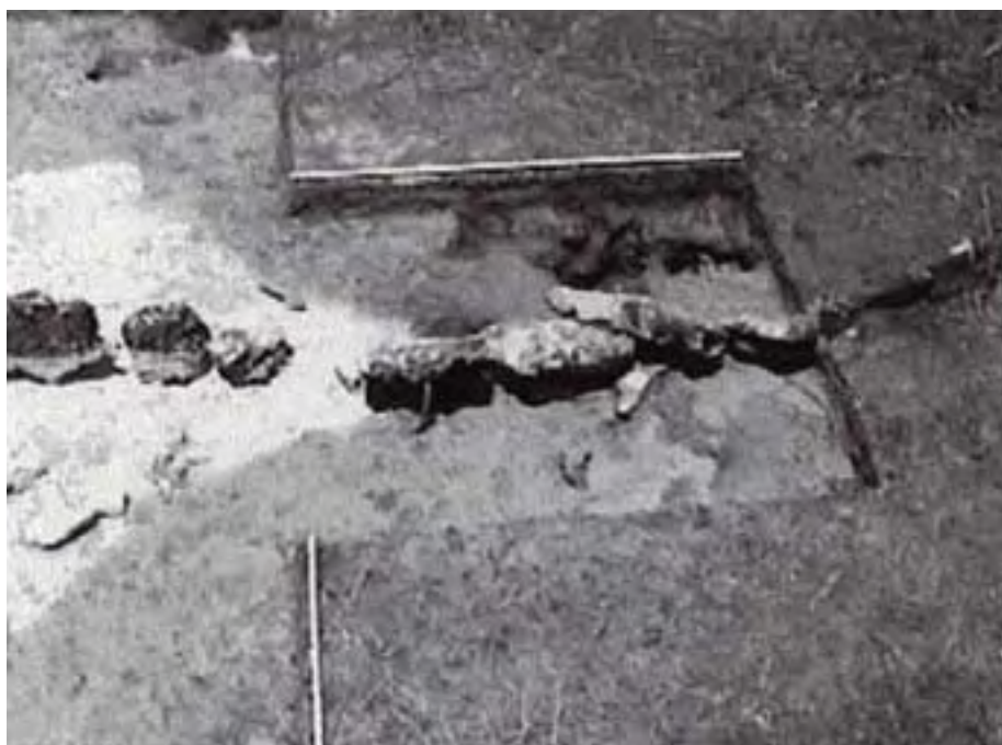
Figura 12. Área expuesta del lecho rocoso y del Alineamiento 41 (la vara blanca cerca de la parte superior de la fotografía mide 2 m de largo).

Las excavaciones de prueba en los dos elementos registrados como posibles estructuras, en el borde sudoeste de las tierras pantanosas, efectivamente revelaron lo que parecería ser la base de un muro y una pequeña cantidad de relleno de cimiento hecho de grava/piedras, que es consistente con una interpretación de estos elementos como casas de campo. En asociación con las posibles estructuras, se hallaron unos pocos tiestos no diagnósticos.