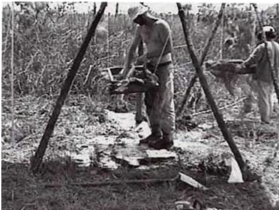
Figura 11. Realizando un tamizado con agua.

Las dos posibles estructuras situadas en el borde sudoeste de las tierras pantanosas fueron estudiadas cada una con una única unidad de excavación de 2 x 2 m, usando métodos idénticos a los de las excavaciones de los elementos de alineamientos rocosos.