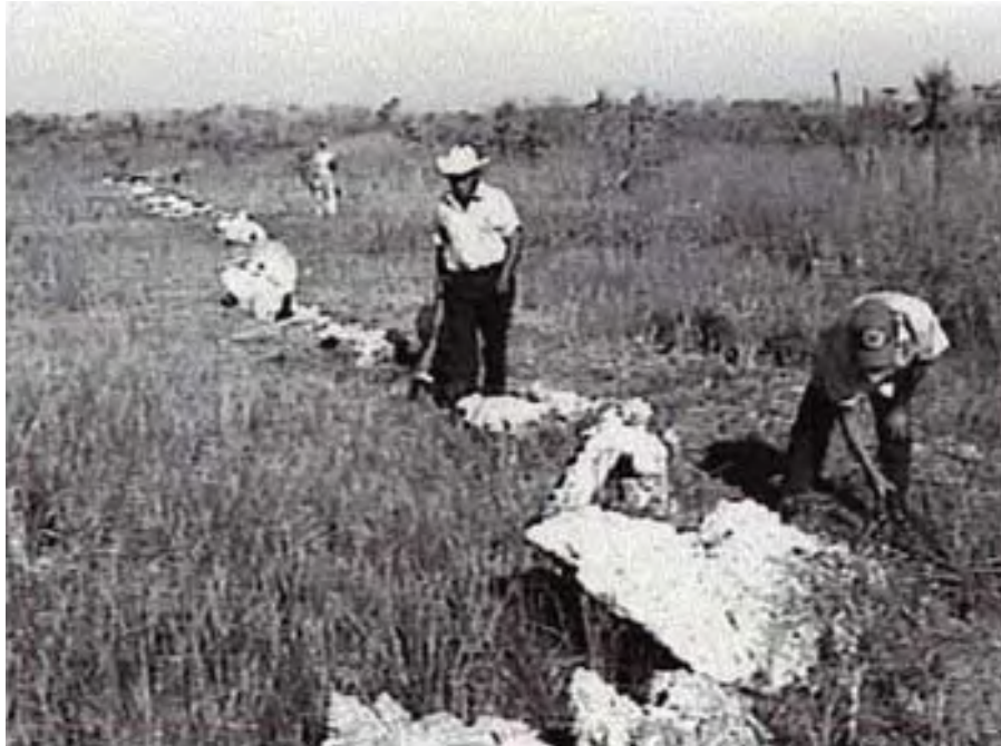
Figura 7. El Alineamiento 41, ubicado en el extremo norte de las tierras húmedas de El Edén, y que tiene aproximadamente 700 m de largo.

alineamientos rocosos paralelos que aparentemente corren en forma perpendicular a un declive muy leve del terreno que va de norte a sur.