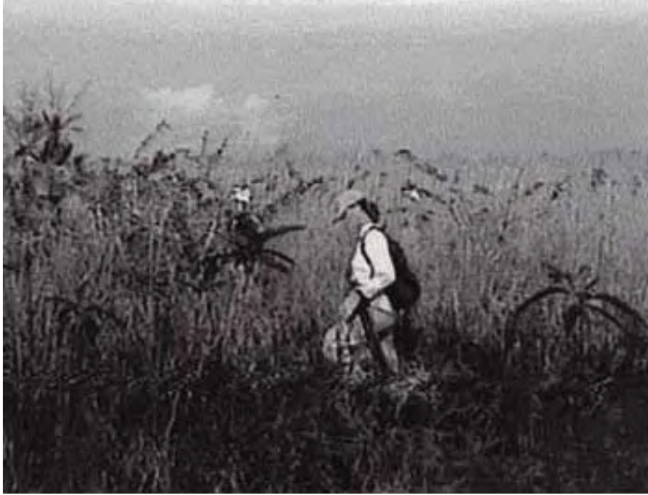
Figura 3. Reconocimiento arqueológico dentro de las tierras pantanosas de El Edén.