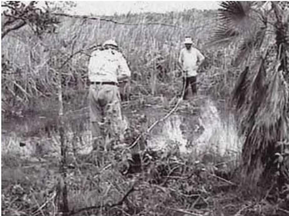
Figura 8. Mapeando un alineamiento que cruza un canal lleno de agua.