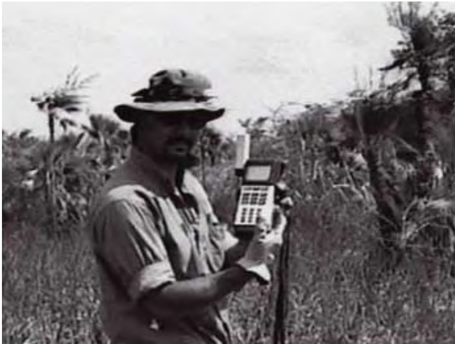
Figura 5. Usando el receptor de un Sistema de Posicionamiento Global (GPS) para determinar la ubicación de un elemento.

Un equipo de cuatro a seis arqueólogos realizaron un reconocimiento sistemático caminando por brechas espaciadas a intervalos de 10 a 20 m, dependiendo de la densidad de la capa de vegetación ( Figura 3 , arriba). El reconocimiento se extendió hasta los márgenes de las tierras pantanosas, según quedaron definidos por un claro cambio en la comunidad de la vegetación. Cada elemento identificado se mapeó con cinta y brújula, se describió, fotografió, y marcó con un rótulo de aluminio inscrito con un número secuencial ( Figura 4 , arriba, y Figura 5 , abajo). La ubicación de cada elemento fue determinada por medio del uso de un receptor de base satelital de un Sistema de Posicionamiento Global (GPS), y con la ayuda de una fotografía aérea ampliada de las tierras húmedas ( Figura 6 , abajo).