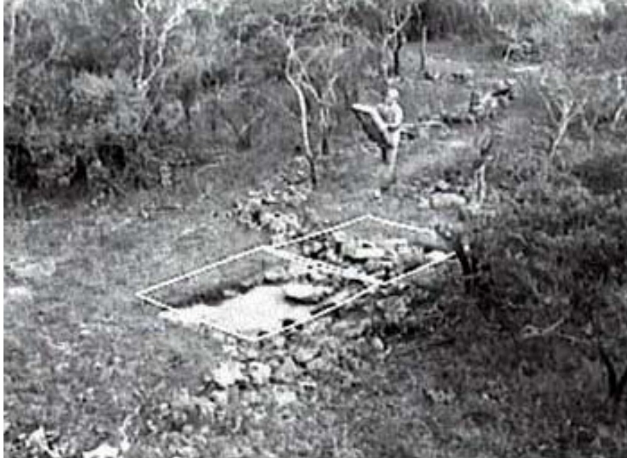
Figura 9. Excavaciones en el Alineamiento 57.