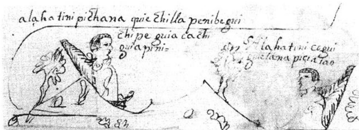
Figura 3. Pintura del Señor 1 Caimán (izquierda) y el Señor 6 Muerte Gran Águila (derecha) en la Genealogía de San Lucas Quiavini.

La siguiente sección proporciona una discusión preliminar de cuatro nombres de calendario y personales mencionados en los Cuadernos 100 y 101 que pueden referirse a ancestros fundadores conocidos de varias comunidades zapotecas de Villa Alta. Hay otros nombres en el cuerpo que se refieren a otros antepasados fundadores, pero aquí estoy limitando mis comentarios a cuatro nombres personales que se han identificado concluyentemente.