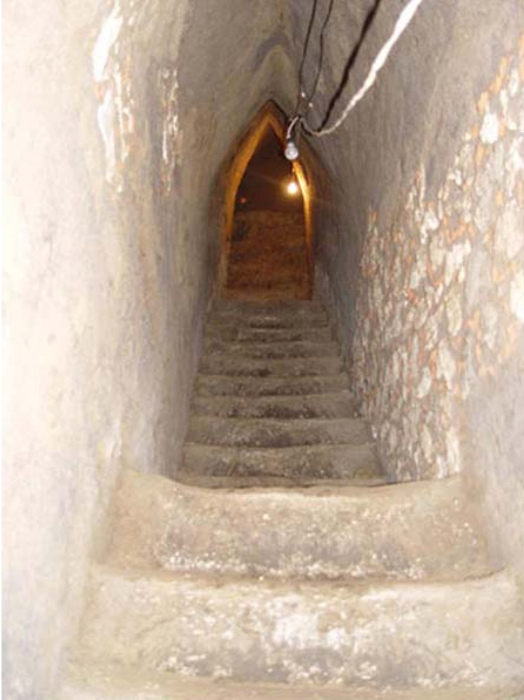
Figura 6. Túnel este-oeste, siguiendo la escalera central de la construcción de la fase A.

Marquina (1970a:39) menciona que la fachada norte de la Estructura I-B fue objeto de otros episodios de modificación y ampliación, aunque no proporciona demasiados detalles. En su estudio de las paredes del túnel, Amparo Robles descubrió que había otra fachada en el lado norte, en talud-tablero , que había quedado dividida por los túneles en el relleno que cubría la Estructura I-B, y que nosotros hemos designado