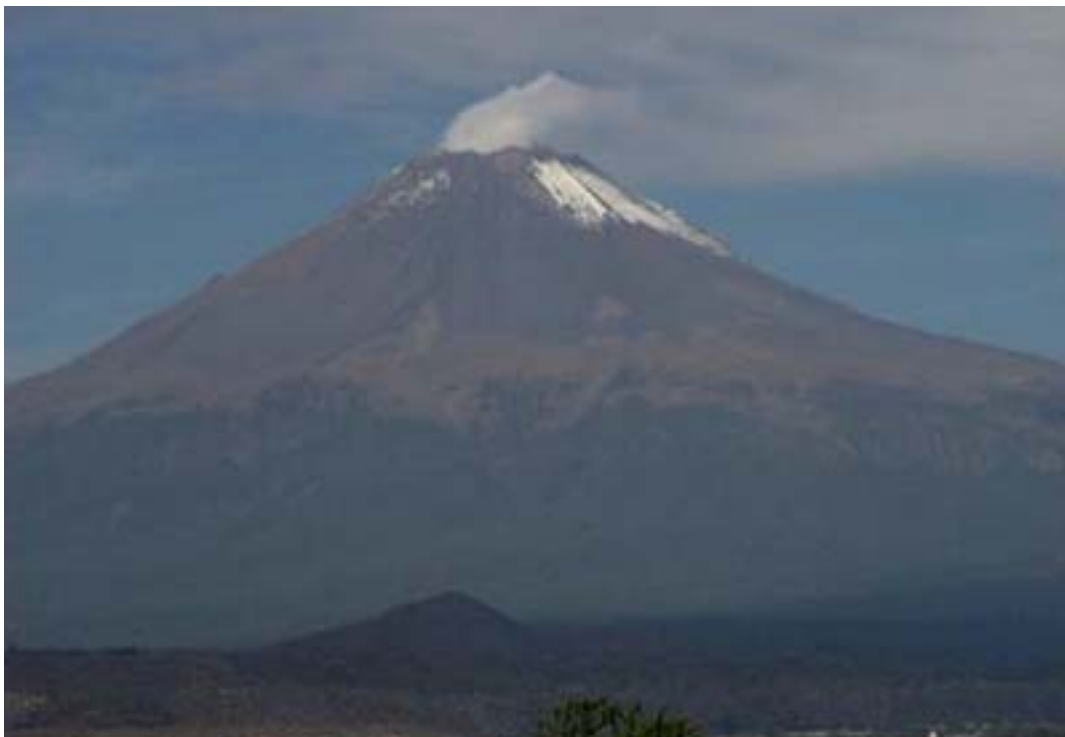
Figura 2. Volcán Popocatepetl; la franja oscura en la base del volcán es el flujo de lava conocido como el Pedregal de Nealtican.

Debido a esta situación, es difícil entender los orígenes de la Cholula urbana, y evaluar la relación entre la ciudad y otros asentamientos del valle de Puebla-Tlaxcala o de la gran Mesoamérica. El proyecto "Fecha Cholula" fue diseñado para iniciar el desarrollo de una secuencia cronológica independiente para Cholula basada en fechas radiocarbónicas de contextos arqueológicos excavados. En particular, buscábamos explorar la posibilidad de que la arquitectura monumental del sitio se hubiera desarrollado –al menos en parte– como una respuesta político-religiosa adaptativa, en momentos en que la población buscaba la manera de palear los conflictos de orden ecológico, social, político, económico e ideológico que sin duda se dieron inmediatamente después de una gigantesca erupción volcánica del volcán Popocatepetl, que tuvo lugar alrededor de mediados del siglo uno d.C. Este evento espectacular depositó 3.2 \text{ km}^3 de piedra pumítica en un área que se extendió al menos 25 km al este del cráter; poco después, los flujos de lava cubrieron cerca de 50 \text{ km}^2 de las tierras bajas orientales del volcán, bajo una cifra que varió entre los 30 y 100 metros de rocas que bloquearon y desviaron los drenajes, alterando la hidrología de la superficie del occidente del valle de Puebla (Panfil 1996:16-20).