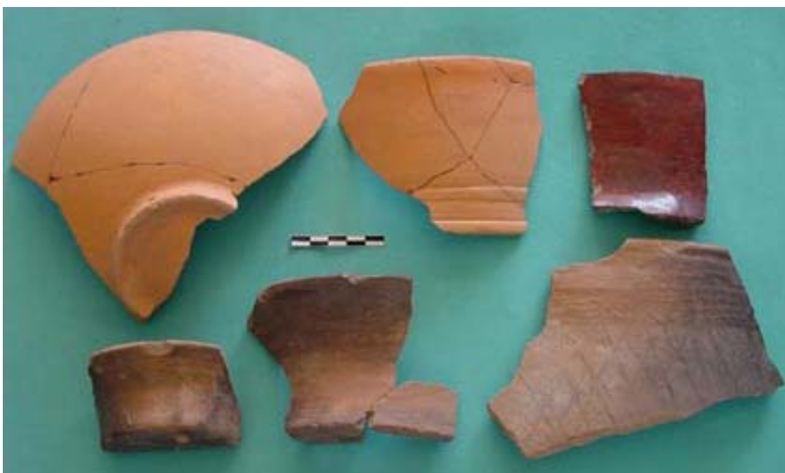
Figura 9. Muestra de cerámicas del período Clásico recuperadas del interior del pozo de agua (Elemento 1, Pozo 6) en Rancho de la Virgen.

chamuscado de las dos plataformas superpuestas de adobe en el Pozo 5, en tanto que más material orgánico provino de un pozo de agua excavado en la superficie de otra plataforma de adobe situada en el Pozo 6. Todas estas fechas tienen rangos de 2 sigma que indican actividad en el Formativo Tardío y Terminal, abarcando desde el siglo dos a.C. hasta mediados del siglo tres d.C. Noguera (1956), de sus excavaciones en el Edificio Rojo reportó cantidades significativas de material del Formativo Tardío. Parecería entonces que el área al norte de la Gran Pirámide fue testigo de una ocupación importante durante este período de tiempo. Sin embargo, la mayor parte de las cerámicas asociadas con la superficie de estas plataformas son del Clásico Temprano, cuando los estilos Teotihuacán Tlamimilolpa eran importantes y se usaban cantidades abundantes de Anaranjado Fino ( Figura 9 , abajo).