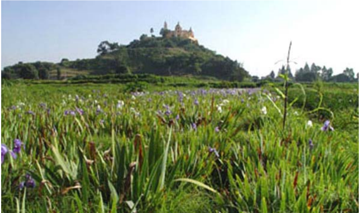
Figura 1. Pirámide de Cholula, Puebla, México.