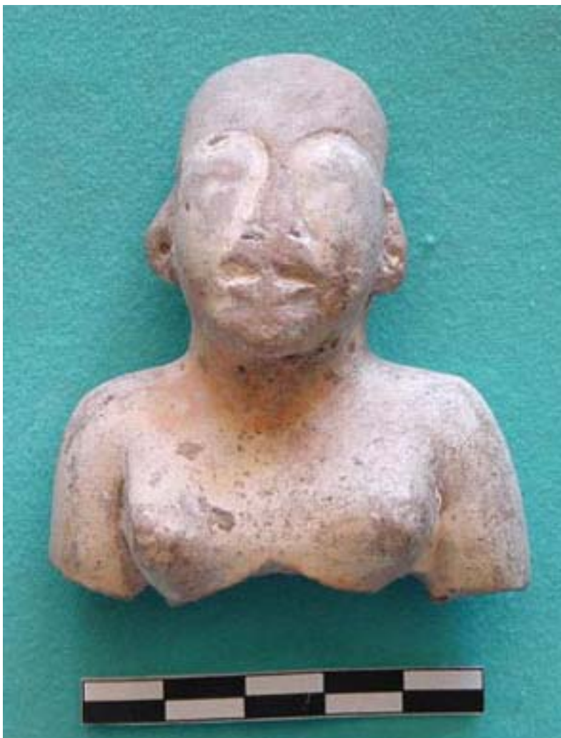
Figura 11. Figurilla del pozo troncocónico en el campus de la Universidad de las Américas, Puebla.