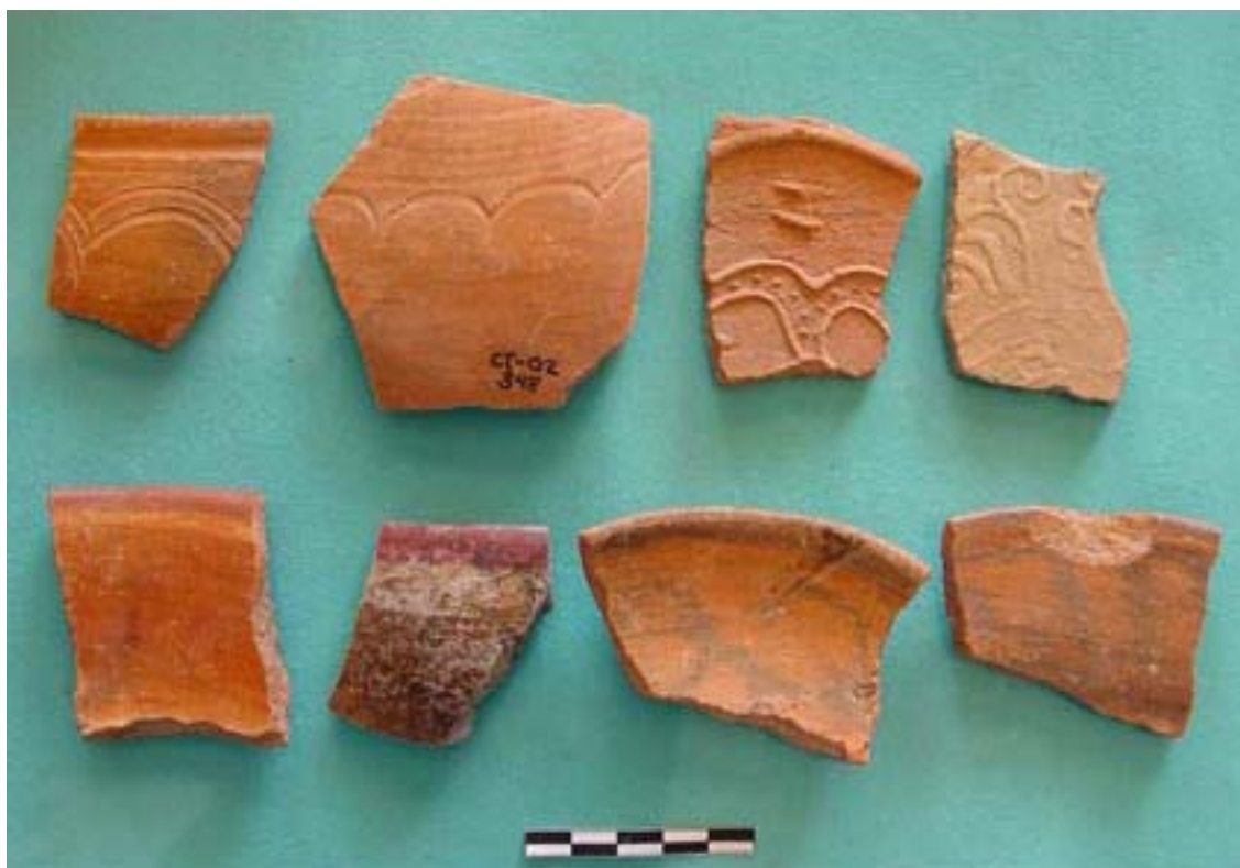
Figura 12. Muestra de cerámicas del Nivel K en las excavaciones del Colegio Taylor.

En mayo y junio del año 2002, la Coordinación de Apoyo Arqueológico de la Universidad de las Américas, Puebla, emprendió excavaciones de sondeo en una parcela de tierra en el medio de la manzana que bordea el lado norte de la plaza principal de San Pedro Cholula (López et al. 2002b, 2004a). Si bien se documentó una secuencia compleja de construcción moderna y colonial en la trinchera exploratoria de 12x2 metros orientada de este a oeste, no se ubicaron restos de edificios prehispánicos en esta excavación. La actividad constructiva posterior a la conquista descansa sobre unos 2.50 metros de arcillas y arenas interdispuestas. La parte más baja de estos estratos consiste en arcillas oscuras que contienen cerámicas del Clásico Tardío, depositadas directamente sobre el tepetate estéril. Dichas arcillas están selladas por una capa de 0.20 a 0.30 metros de ceniza volcánica. Encima de esta ceniza, aparecen por primera vez cerámicas del Posclásico como la Cocoyotla Negro-sobre-Anaranjado, que es similar a la Azteca I (Figura 12, abajo). Las dos fechas que obtuvimos de esta excavación provienen de dos estratos diferentes de sedimentos llevados por el agua y depositados sobre la ceniza volcánica.