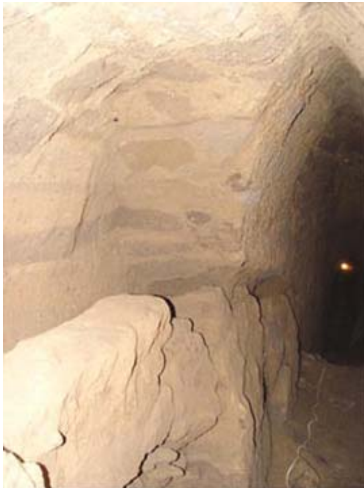
Figura 7. Derrumbe dentro del Túnel 46, que dejó a la vista la pared de adobe 49.

como Estructura I-B 1 . Recuperamos una pequeña muestra de material chamuscado del relleno que estaba encima de este otro perfil en talud-tablero , y que arrojó una fecha de AMS con un rango de 2 sigma para el 40 a.C. al 215 d.C. cal (B-188351). Si bien este resultado podría indicar que las Estructuras I-A, I-B, e I-B 1 fueron construidas en rápida sucesión, creemos que es más probable que los arquitectos de la Pirámide habitualmente hubieran usado basurales de las áreas circundantes como relleno. Es de interés señalar que la fecha no entra en conflicto con nuestra sugerencia en cuanto a que la Estructura I fue cubierta por un edificio enteramente nuevo (la Estructura II), tal vez en una época tan temprana como el siglo tres d.C., o tan tardía como el siglo cinco d.C.