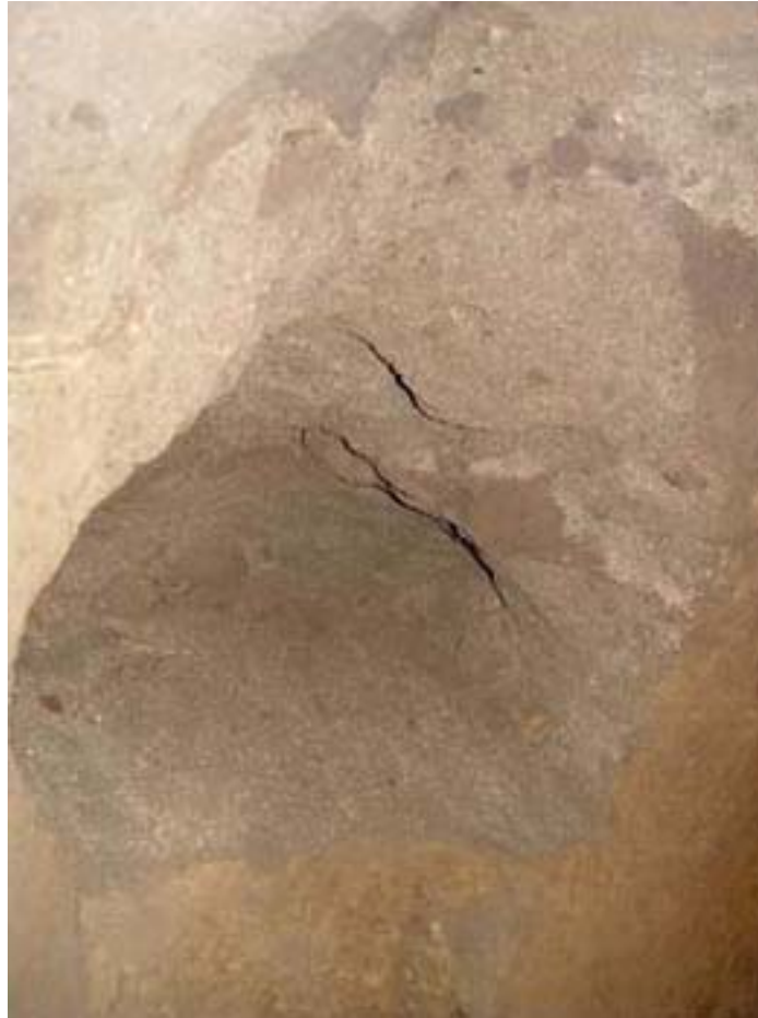
Figura 5. Pozo 2 excavado en el tepetate estéril debajo de la Gran Pirámide.

el mapa de la computadora. Tenemos tres fechas de AMS del relleno de adobe de la Estructura Sub-I-A, que indican que fue erigido en algún momento entre los siglos uno y tres d.C. La gama de 2 sigma de estas determinaciones radiométricas es como sigue: B-162997 [110 a 330 d.C. cal], B-188345 [5 a.C. a 230 d.C. cal], y B-188346 [60 a 260 d.C. cal].