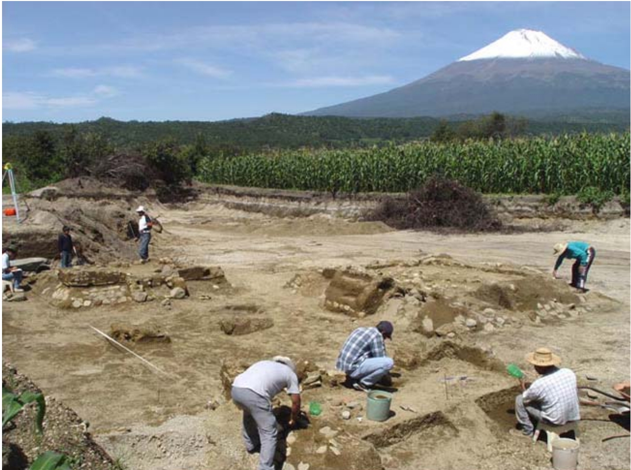
Figura 3. Vista de un complejo de casa (Op. 31) en Tetimpa con el volcán Popocatepetl que se erige al fondo.

primera arquitectura monumental en el corazón ceremonial de la ciudad emergente. Por otro lado, hemos obtenido muestras de otros muchos contextos de los cuales pudimos disponer a través de excavaciones y trabajos de rescate (López et al. 2002a y b, 2004a y b; Plunket y Uruñuela 2002). Este segundo conjunto de fechas es importante, puesto que puede ser usado para anclar el conjunto cerámico en el tiempo.