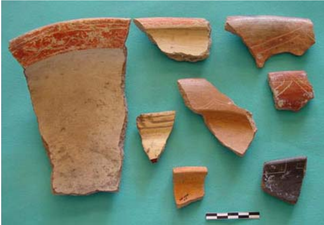
Figura 10. Muestra de cerámicas recuperadas en los pozos troncocónicos del campus de la Universidad de las Américas, Puebla.

795 a.C. cal, y una intercepción para el 930 a.C. cal (Beta 188355), el material fechado más antiguo registrado para Cholula ( Cuadro 4 ).