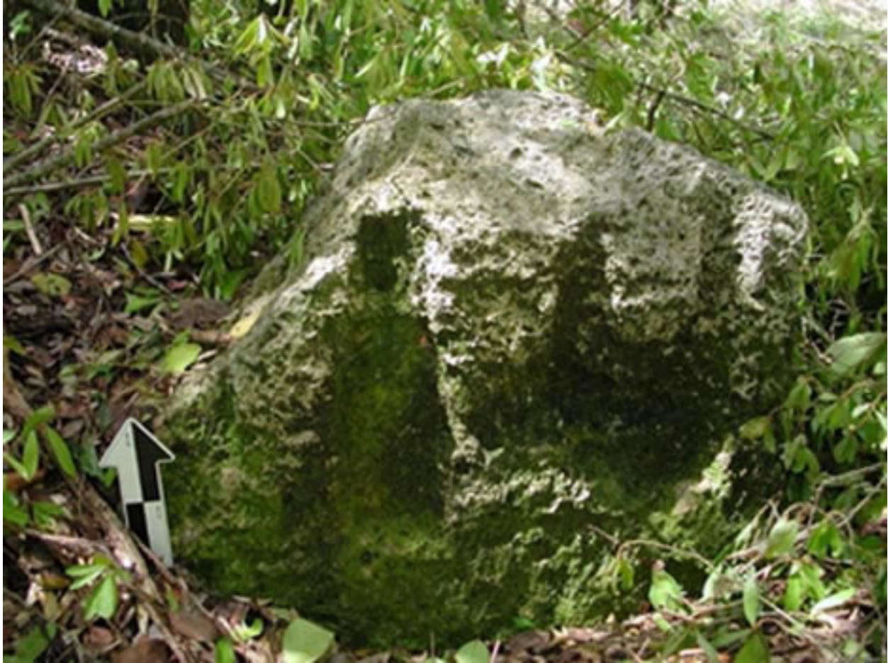
Figura 3. Estela 1 de Uaymil.