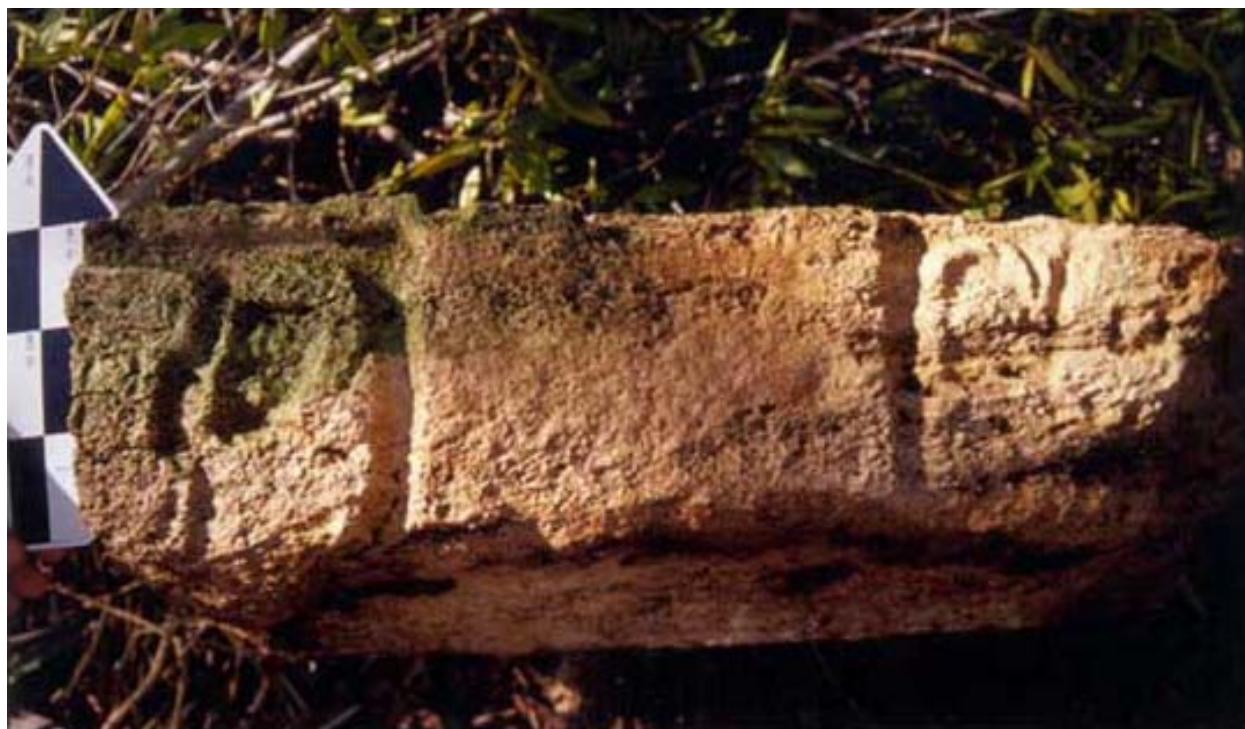
Figura 4. Capitel 2 de Uaymil.

En base a las cerámicas, como así también a la evidencia arquitectónica, investigadores como Andrews (1977:60; 1997:4), Andrews y Vail (1990:42), Ball (1978:137-141), y Shook (1955), han sugerido que el apogeo de Uaymil tuvo lugar después del 800 d.C. y que fue contemporáneo a Chichén Itzá y Uxmal. Nuestros primeros resultados del análisis de los materiales recolectados en Uaymil confirman dicha proposición, y nosotros sugerimos que Uaymil tuvo una función específica en el momento de su mayor esplendor.