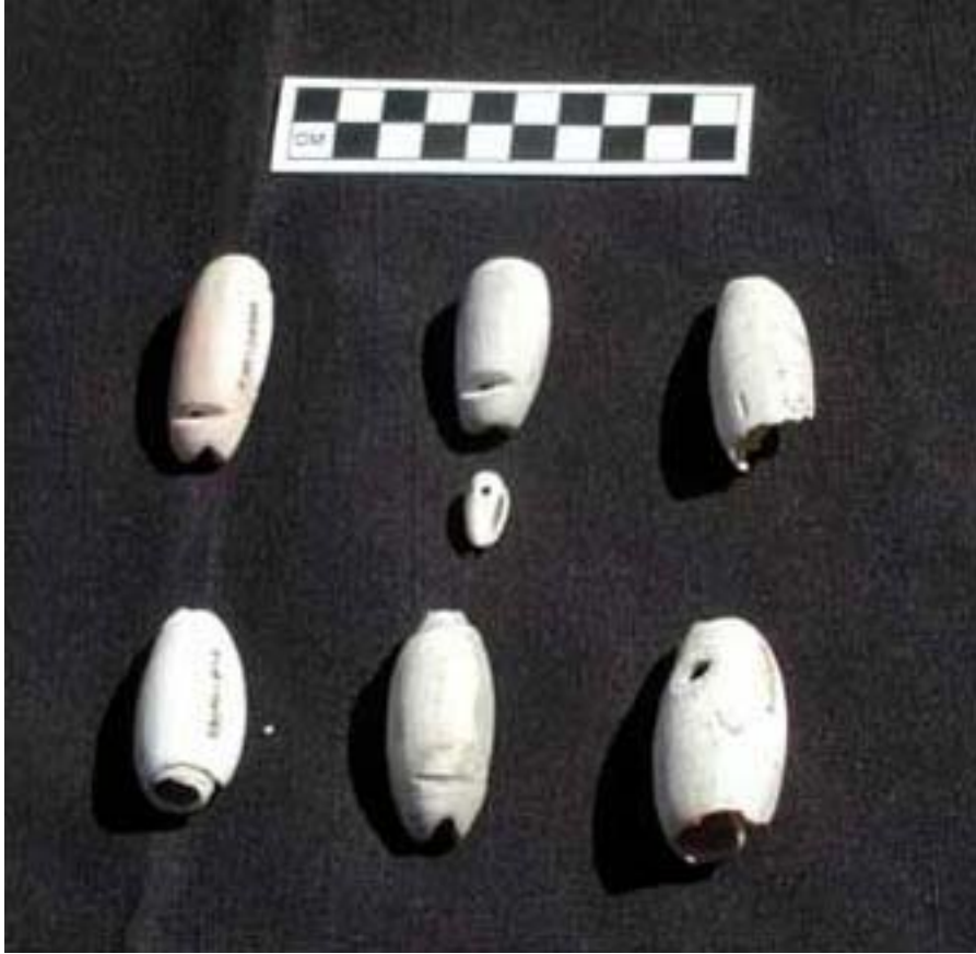
Figura 13. Colgantes de concha.