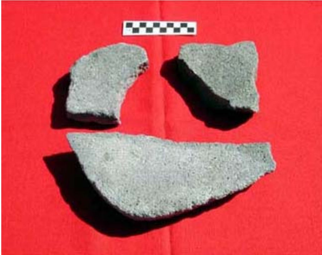
Figura 8. Fragmentos de Metates.