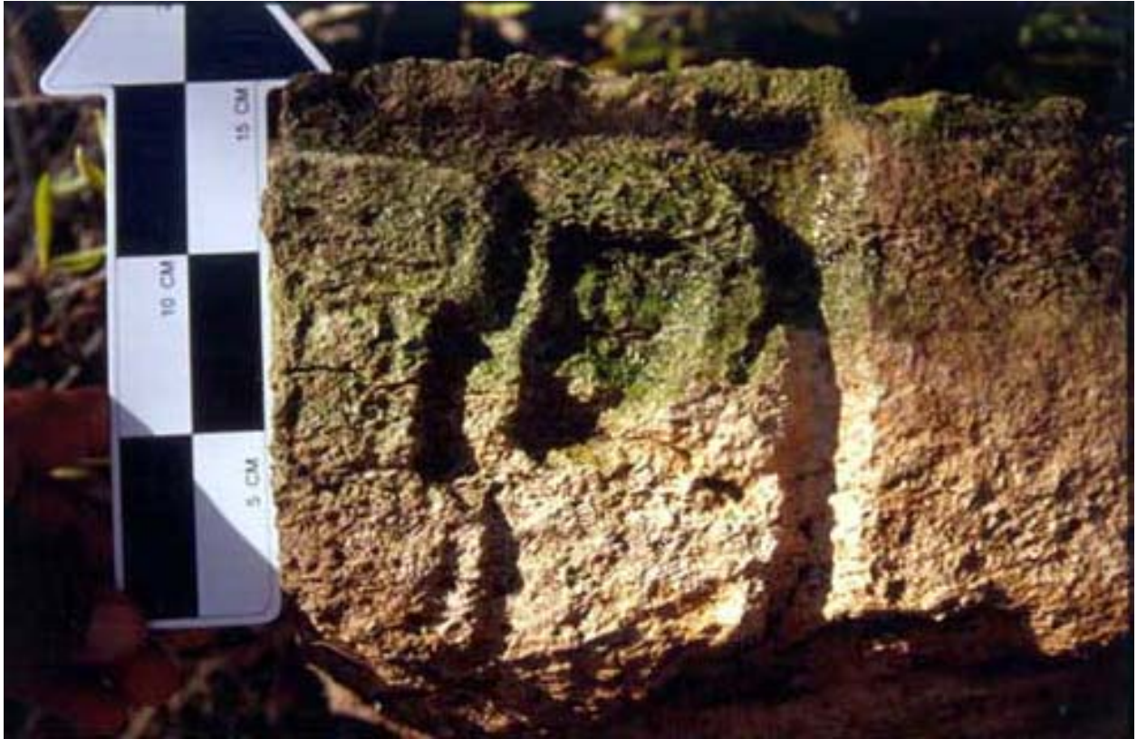
Figura 5. Capitel 2 (detalle).