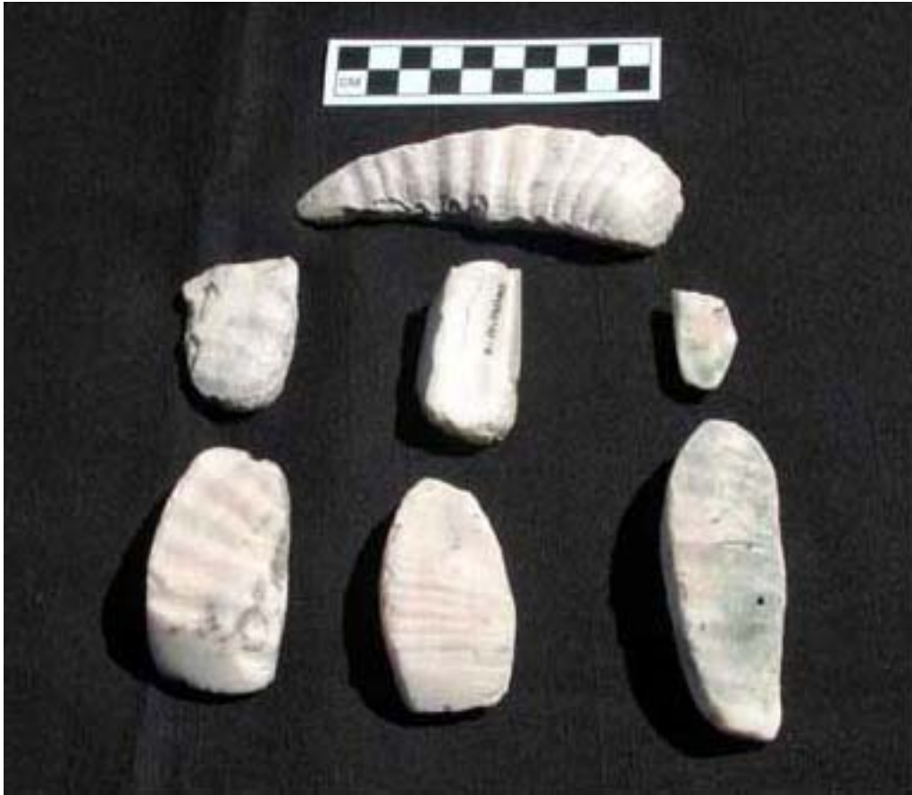
Figura 14. Hachas halladas en Uaymil.