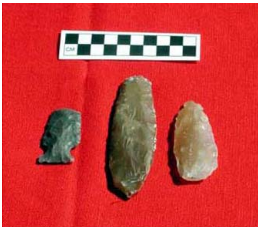
Figura 11. Puntas de proyectil hechas pedernal, halladas en Uaymil.