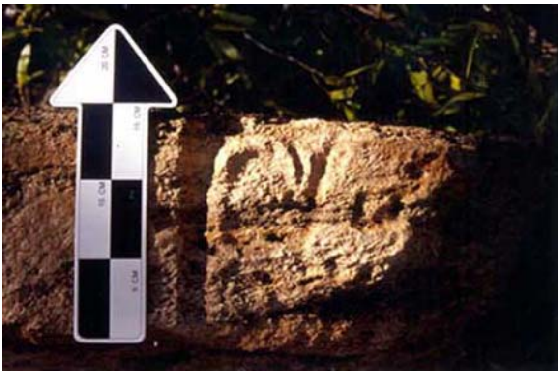
Figura 6. Capitel 2 (detalle).