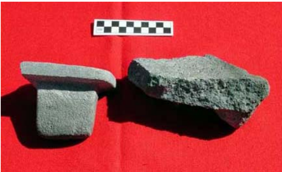
Figura 9. Fragmentos de Metates.