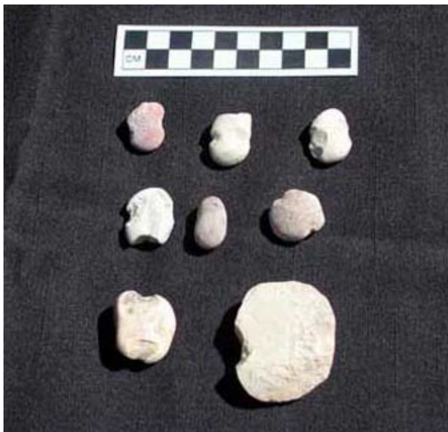
Figura 10. Tiestos con muescas hechos de piedra caliza.