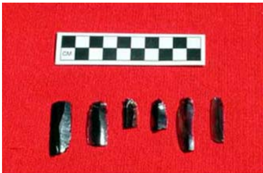
Figura 7. Navajas de obsidiana.

Se recuperó un total de 30 artefactos de obsidiana durante el relevamiento de superficie y el mapeo de Uaymil. Todos estos artefactos son navajas prismáticas ( Figura 7 , Cuadro 2 ). Veintiséis (o el 87%) de los artefactos de obsidiana fueron asignados, de manera preliminar, a fuentes geológicas de México y Guatemala. Haciendo uso de un criterio visual, y con el apoyo de los análisis efectuados a los objetos de obsidiana de varios sitios de las tierras bajas mayas del norte, hemos logrado identificar las fuentes probables de 26 de los 30 artefactos (véase también Braswell, 1997; 1999).