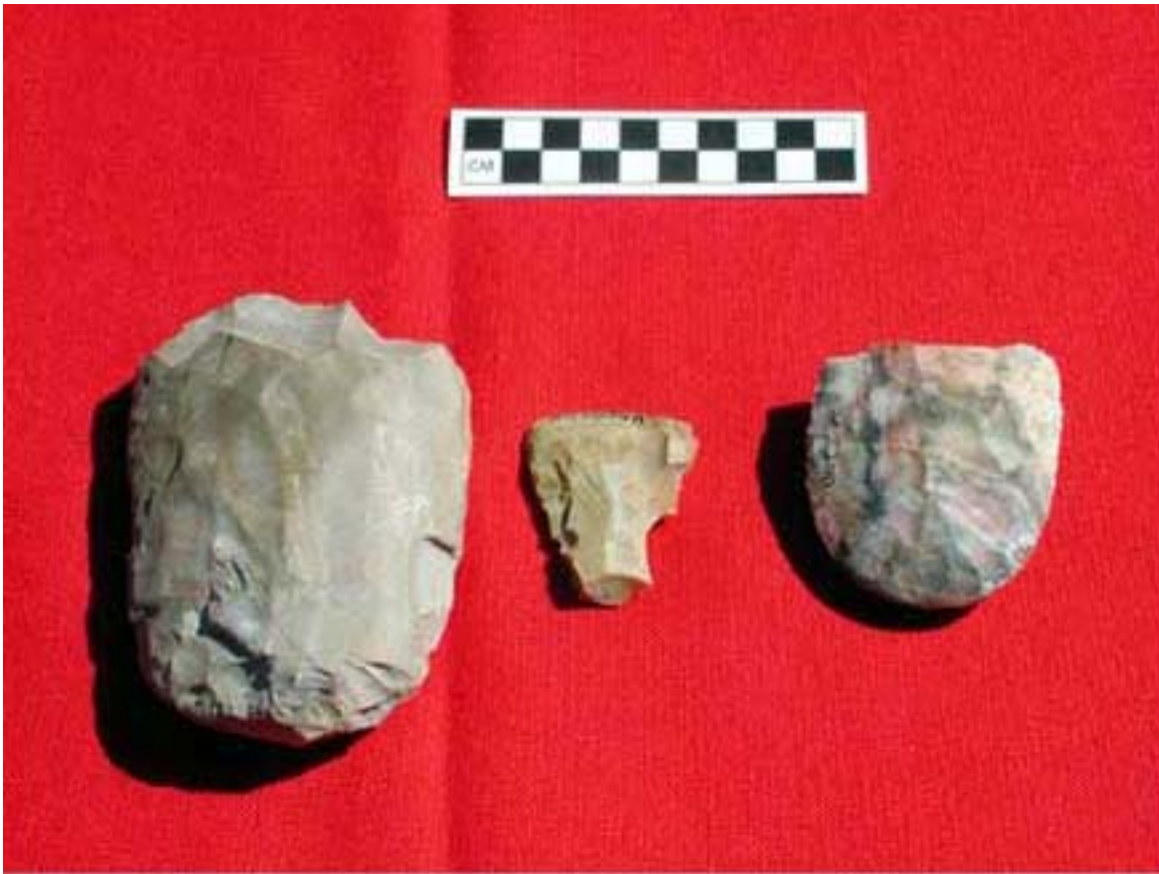
Figura 12. Artefactos de pedernal hallados en Uaymil.